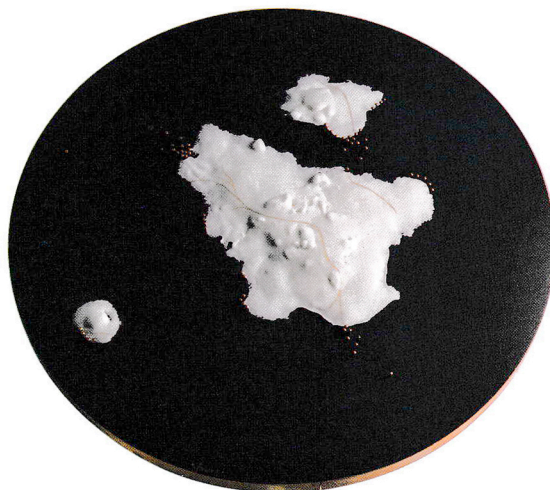
Paysage Territoire Nuit #2 CÉLIA PASCAUD

Jaseron argent et fils métallisés brodés sur impression textile d'après photogramme 40 x 30 cm, sous cadre 55 x 45 cm Prix : 1 990 €