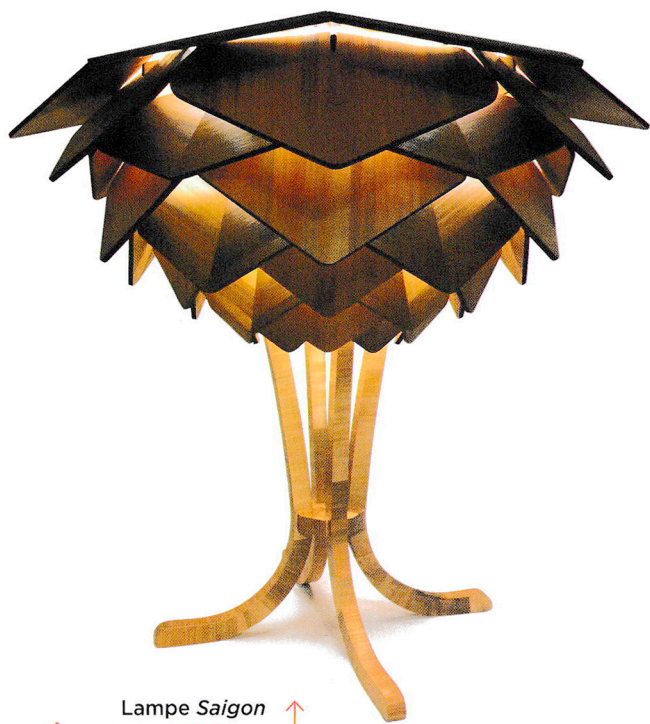
Lampe Saigon GRÉGORY PIERSON

Marqueterie de paille, paille de seigle teintée (origine Bourgogne) Ø 50 cm, h. 50 cm Prix : 3 800 €